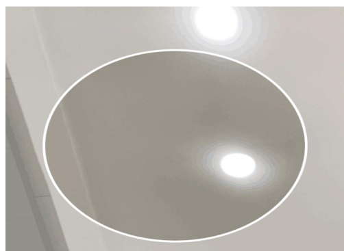
请按图示将人脸放入取景框中